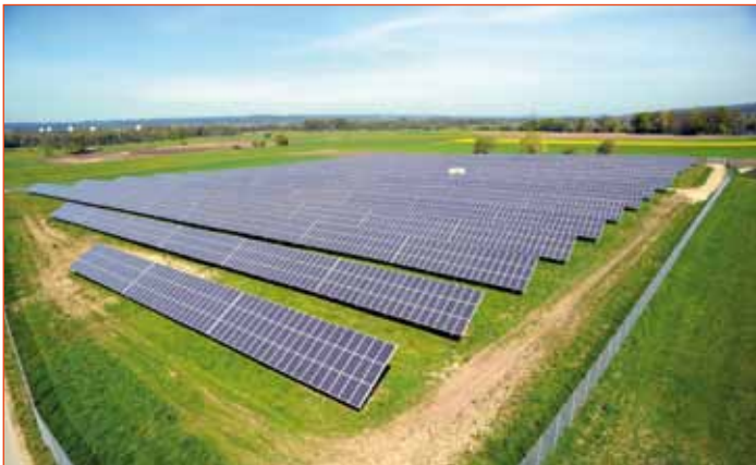
Wattner Solarkraftwerk Pähl